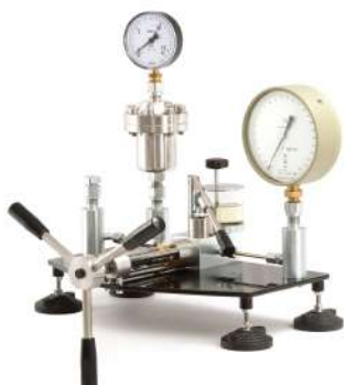
Гидравлическая установка сравнительной калибровки ГУСК, с разделителем сред РГБ

По дополнительному запросу разделители сред РГБ, РПГ могут комплектоваться устройствами для создания давления ГУСК, манометрами грузопоршневыми МП, шлангами высокого давления и другим вспомогательным оборудованием.