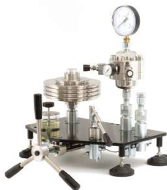
Манометры грузопоршневые МП, с разделителем сред РПГ