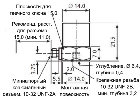
Рисунок 1. Габариты прибора 4383

Акселерометры Unigain имеют чувствительность, откалиброванную к удобному значению, такому как 1, 3,16 или 31,6 пКл/мс -2 . Чувствительность, указанная в калибровочной таблице, измерена на частоте 159,2 Гц с уровнем доверительной вероятности 95% и коэффициентом перекрытия k = 2 .