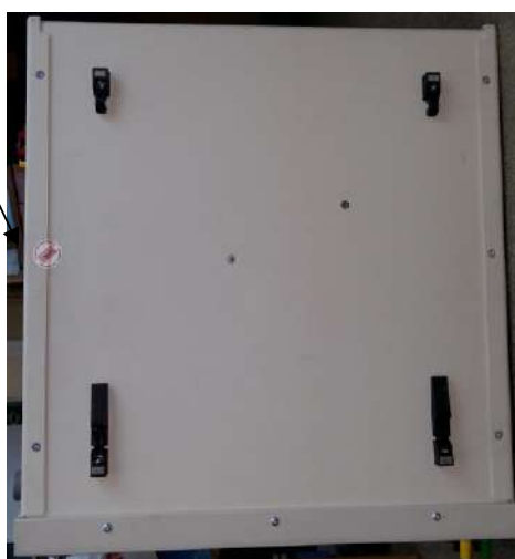
Рисунок 3 – Место пломбировки от несанкционированного доступа

Место пломбировки от несанкционированного доступа