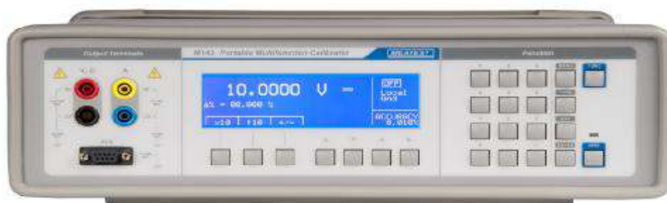
Рисунок 3 – Фотография передней панели CALIBRO-143