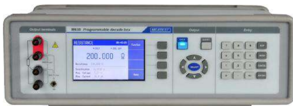
Рисунок 4 – Фотография передней панели магазина M630