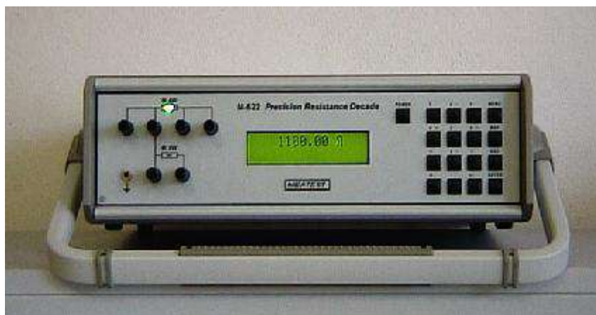
Рисунок 3 – Фотография передней панели магазина M622