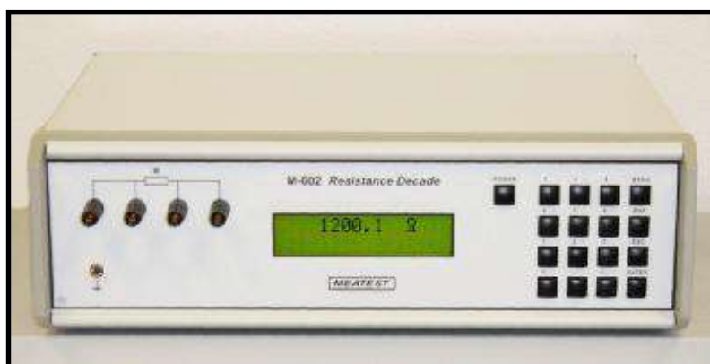
Рисунок 2 – Фотография передней панели магазина М602