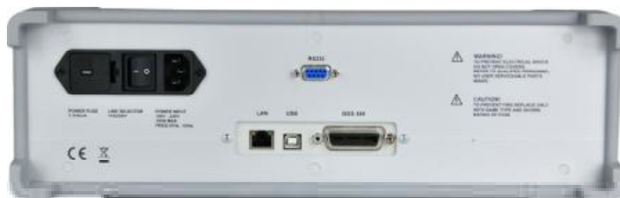
Рисунок 2 – Фотография задней панели магазинов М525