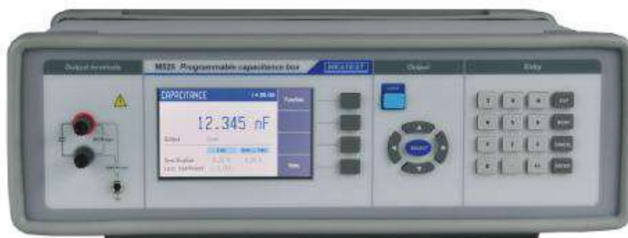
Рисунок 1 – Фотография передней панели магазинов М525

Фотографии общего вида магазинов представлены на рисунках 1, 2, 3, 4.