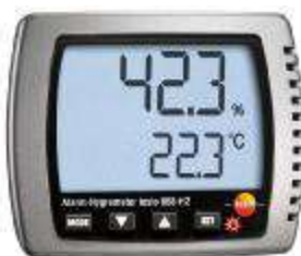
Рис. 2. Прибор комбинированный Testo 608-H2