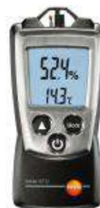
Рис. 3. Прибор комбинированный Testo 610