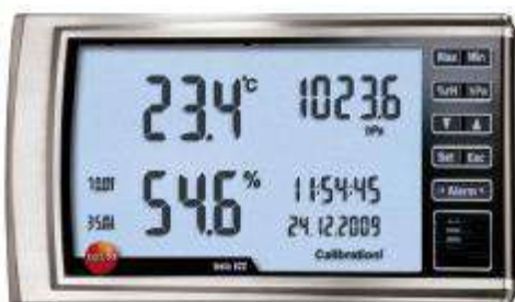
Рис. 4. Прибор Комбинированный Testo 622