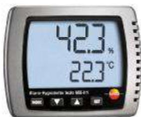
Рис. 1. Прибор комбинированный Testo 608-H1

Внешний вид приборов комбинированных показан на рисунках 1-5