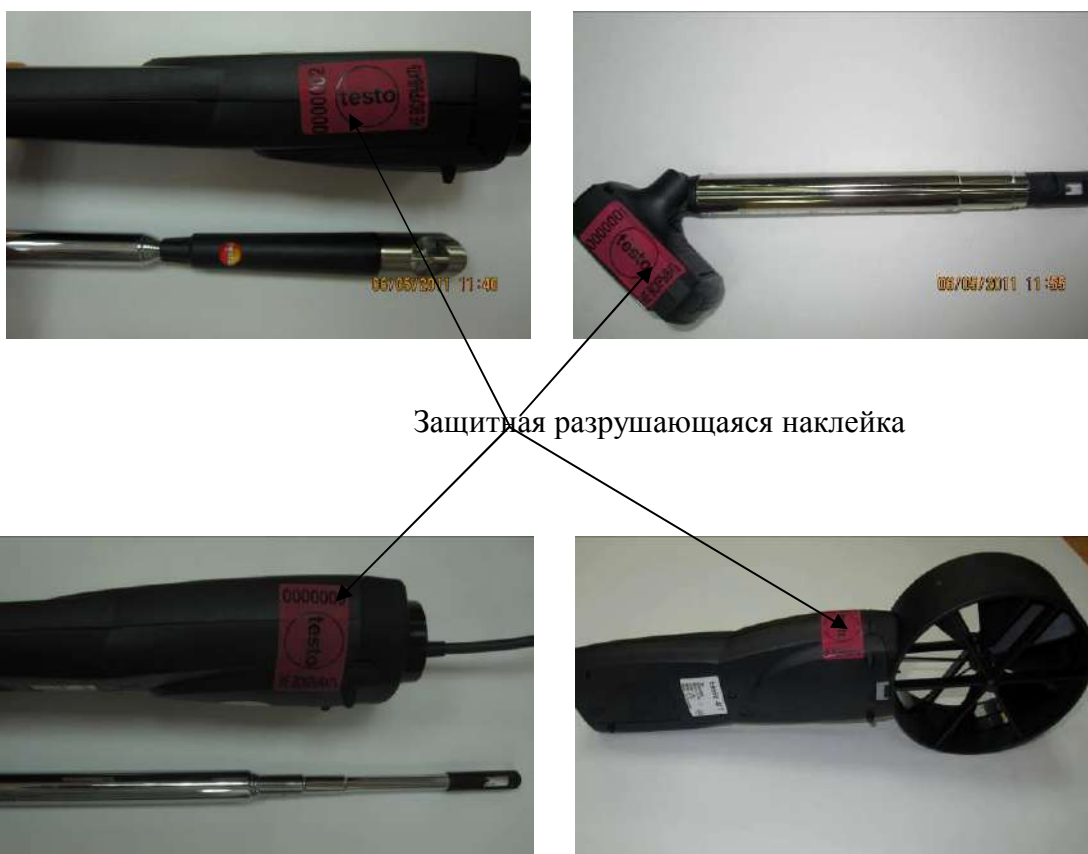
Защитная разрушающаяся наклейка