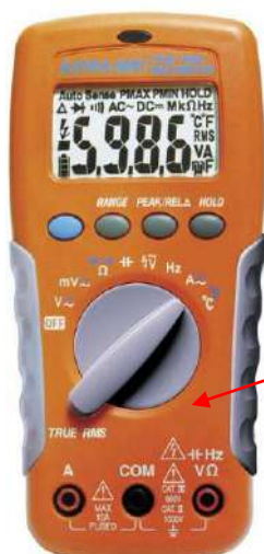
APPA 66R, APPA 66RT