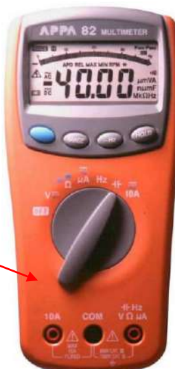
APPA 80, APPA 82, APPA 82R