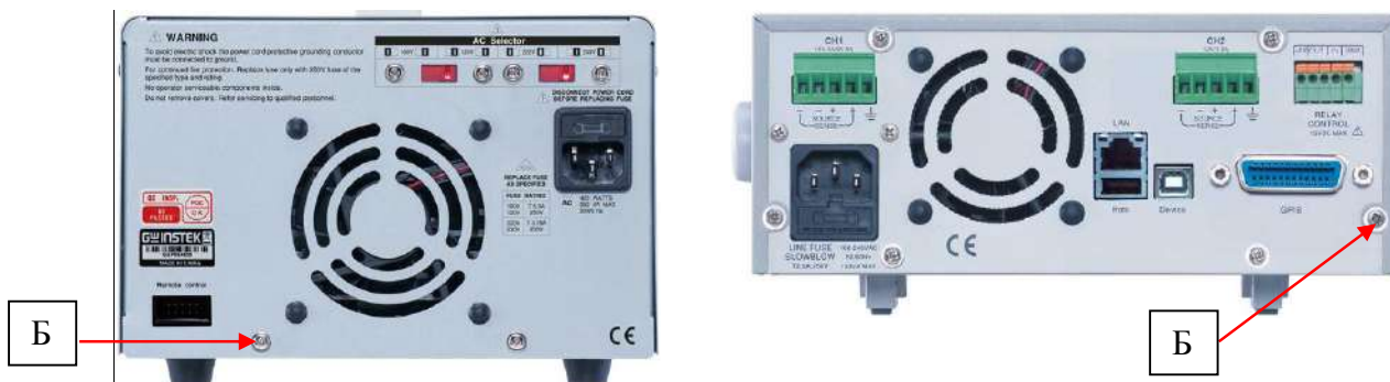
Рисунок 2 - Вид задней панели источников, место пломбировки от несанкционированного доступа (Б)