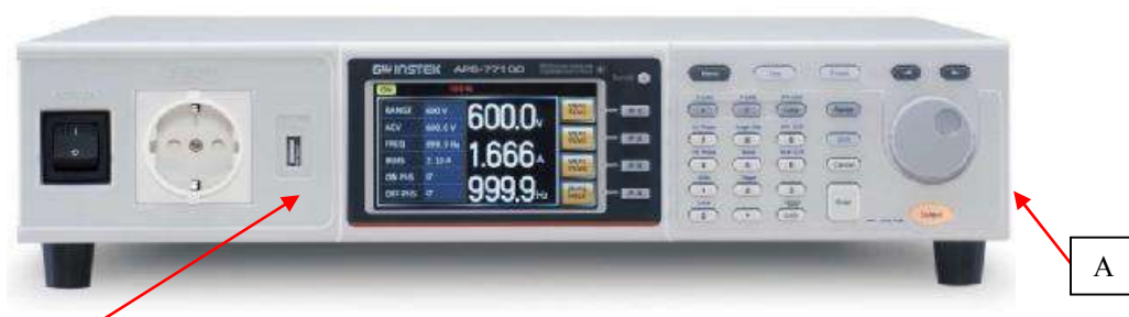
Источники APS-77050, APS-77100