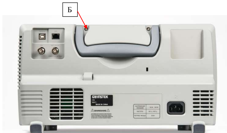
Рисунок 3 – Вид задней панели осциллографов и схема пломбировки от несанкционированного доступа (Б)

Метрологические и технические характеристики представлены в таблицах 2 – 4.