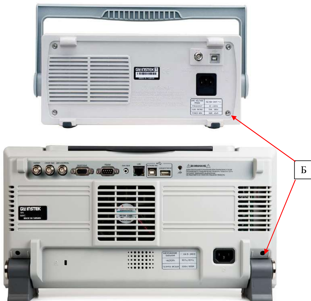
Рисунок 3 –Схема пломбировки от несанкционированного доступа (Б)