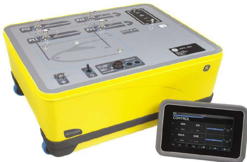
Рисунок 7 Прибор цифровой для проверки систем воздушных сигналов ADTS, модификации ADTS 554F

Метрологические и технические характеристики приведены в таблице 3 и таблице 4.