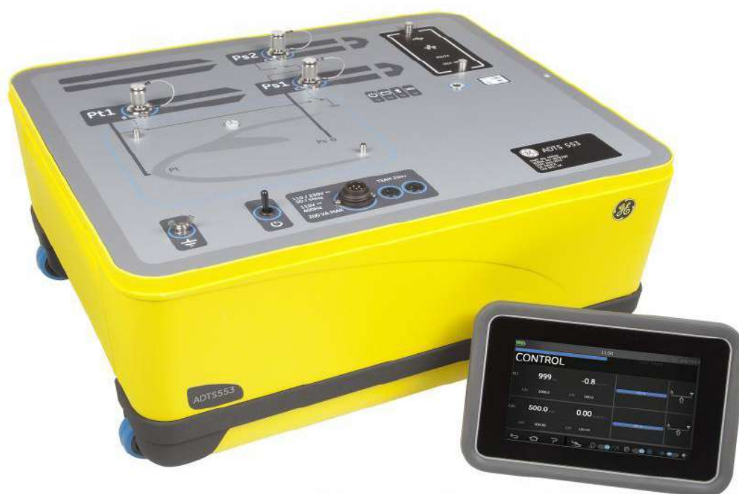
Рисунок 6 Прибор цифровой для проверки систем воздушных сигналов ADTS, модификации ADTS 553F