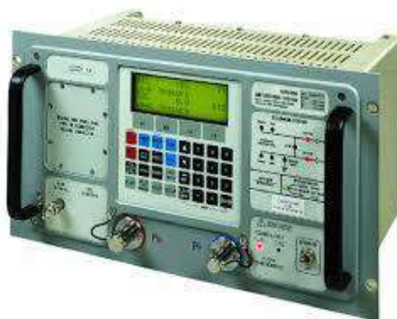
Рисунок 2 Прибор цифровой для проверки систем воздушных сигналов ADTS, модификации ADTS 405, ADTS 405 Mk2 панельной конструкции для установки в приборную стойку