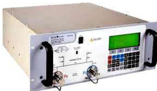
Рисунок 1 Прибор цифровой для проверки систем воздушных сигналов ADTS, модификации ADTS 403, ADTS 403 Mk2